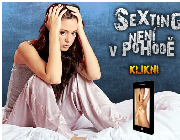
Obrázek č. 7: Úvodní stránka portálu Sexting.cz

Se sextingem se můžete blíže seznámit na portále www.sexting.cz .