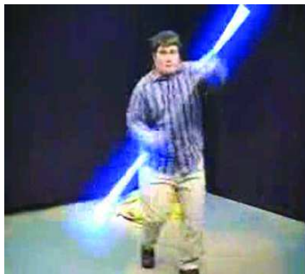
Obrázek č. 1, 2: Ukázka z originální a upravené nahrávky

Původní videoukázku můžete nalézt zde: http://www.youtube.com/watch?v=HPPj6vilBmU