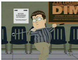
Obrázek č. 3: South Park – epizoda Canada on Strike