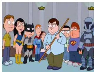
Obrázek č. 4: American Dad – epizoda All About Steve

Když se chlapec dozvěděl o své nečekané popularitě, utrpěl těžký psychický otřes a musel se podrobit dlouhodobému léčení. Nahrávka totiž opravdu nebyla zrovna povedená a velmi okatě demonstrovala jeho nadváhu a neohrabanost, což navíc řada diváků z internetového světa neváhala ventilovat na svých stránkách a blozích.